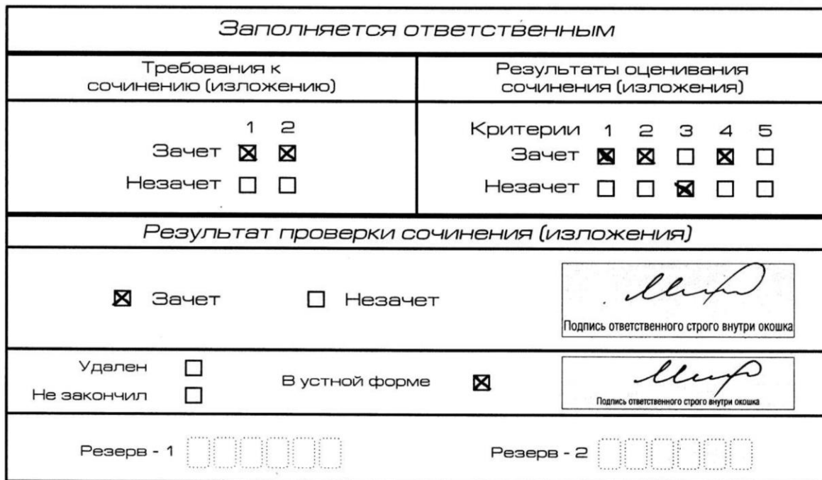
Рис. 9. Область для оценки работы сочинения (изложения) в устной форме