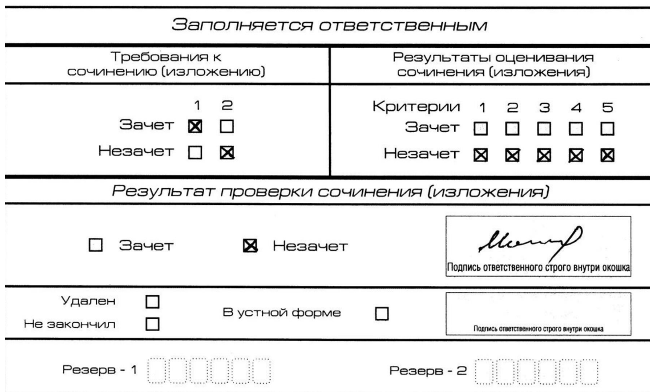
Рис. 7. Область для оценки работы

Если итоговое сочинение (изложение) соответствует требованию №1 и требованию №2, то выставляется «зачет» за выполнение требования №1 и требования №2. Указанные сочинения (изложения) далее оцениваются по критериям.