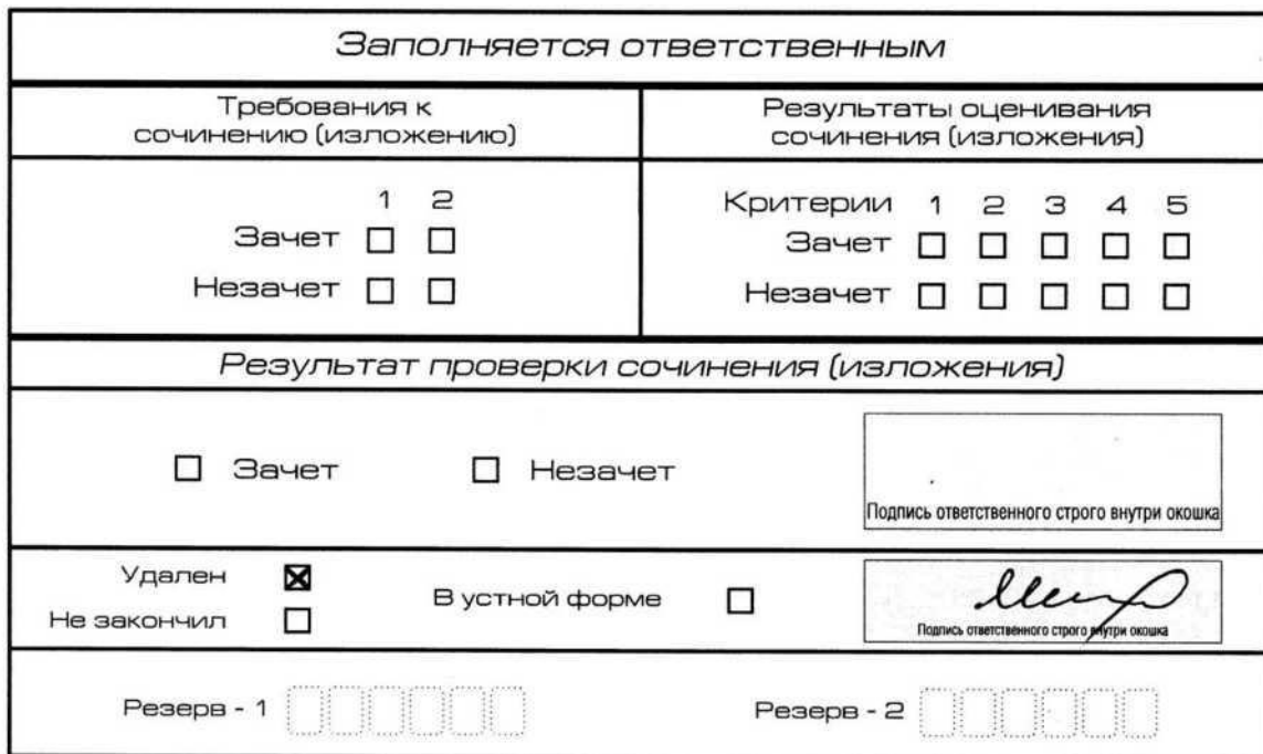
Рис. 11. Заполнение полей нижней части бланка регистрации (участник удален с экзамена)